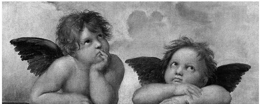
Raffael, sog. Sixtinische Madonna (Ausschnitt), 1512/1513

Freitag, 29. Januar 2016 19.00 Uhr BENEFIKONZERTE des Kammermusikensembles „Memorial“ St.Petersburg