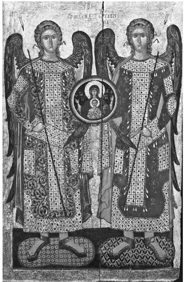
Byzantinische Ikone, Die Erzengel (Bulgarien, Mitte 14. Jh.)