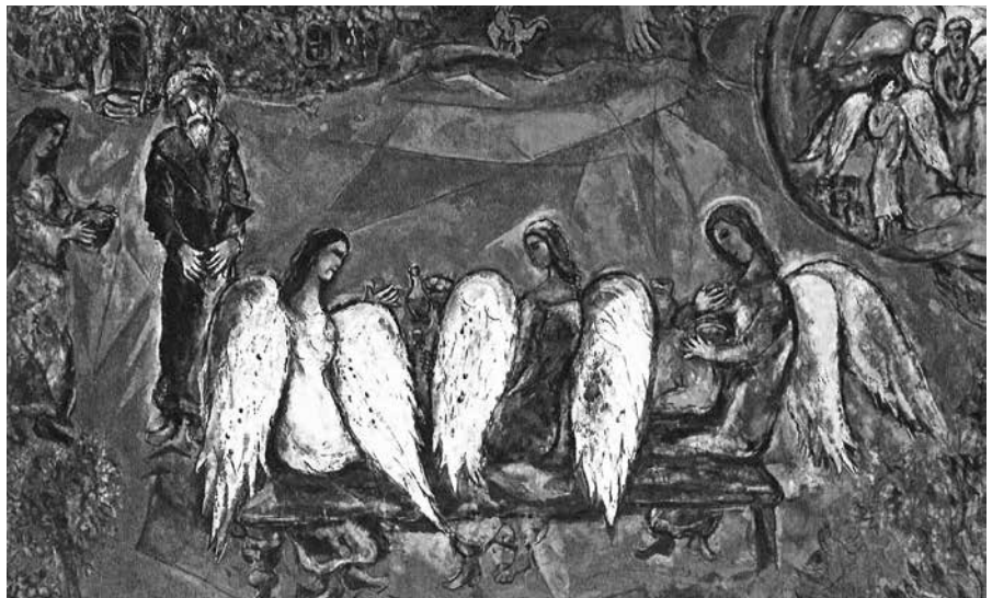
Marc Chagall, Abraham und die drei Engel (1960)